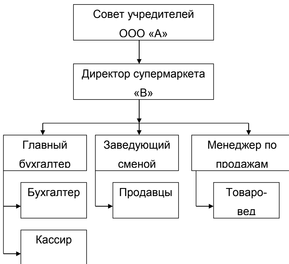
Рисунок В.1 – Организационная структура предприятия