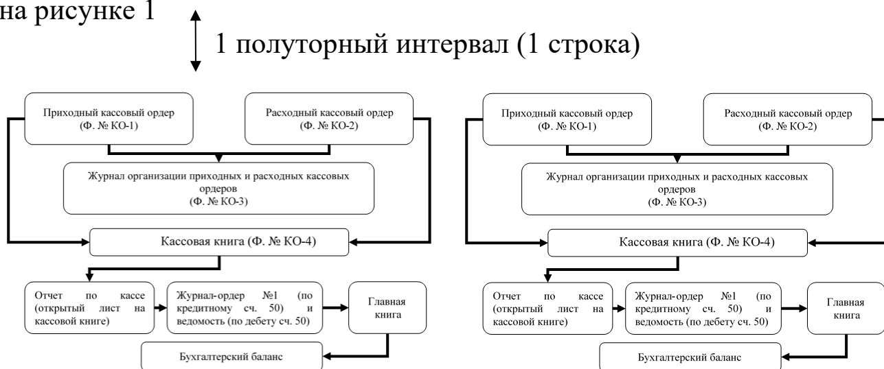
Схема операций по учету денежных средств в кассе представлена на рисунке 1