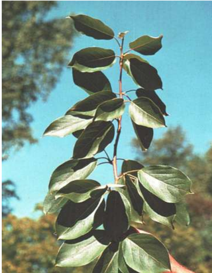
Рисунок 7 – Тополь корейский