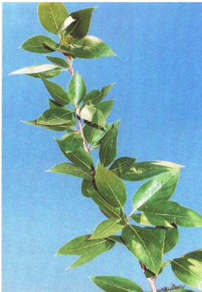
Побег с листьями