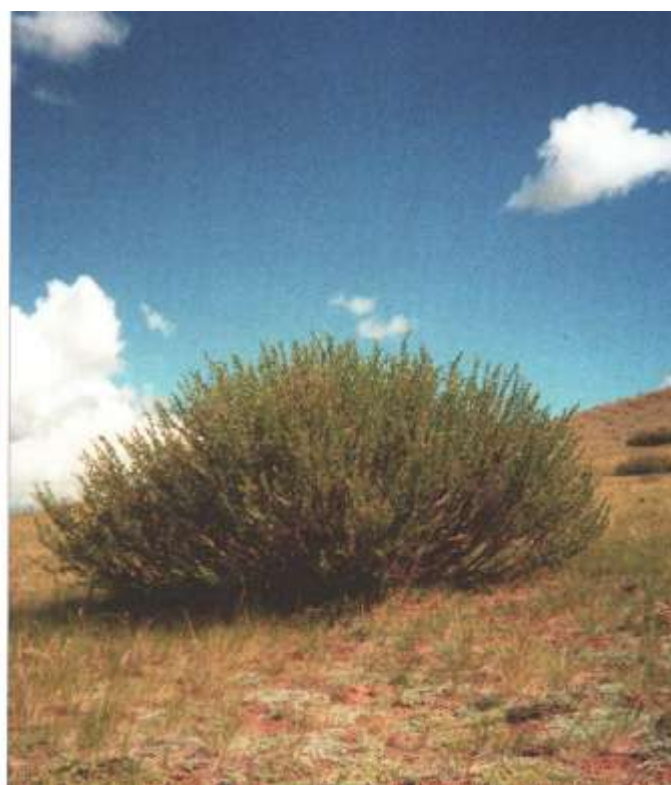
Общий вид растения