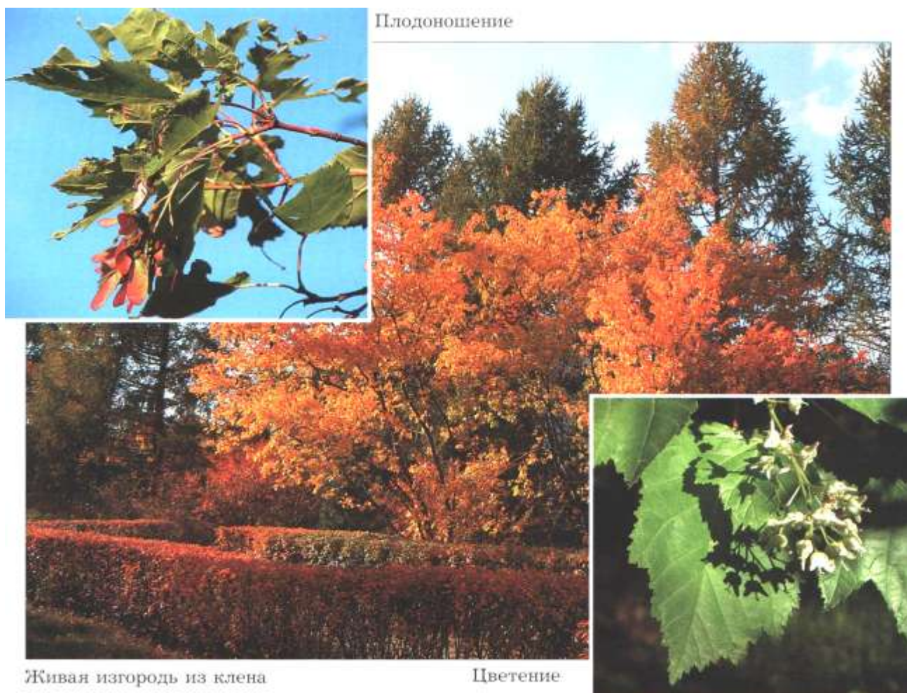
Рисунок 5 – Клен татарский

Размножается семенами. Посев производят свежесобранными семенами осенью. При весеннем посеве семена стратифицируют в течение 4 месяцев (2 месяца при низкой положительной температуре и 2 месяца под снегом). В питомнике выращивают 3–5 лет.