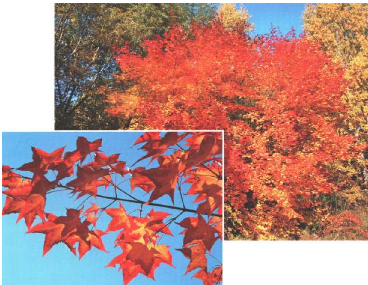
Рисунок 4 – Клен моно, мелколистный (осенняя окраска листьев)

Листопадное дерево до 15 м высотой с густой, низко посаженной кроной. Ареал: Приморье, Приамурье, Сахалин, Корейский полуостров, Северо-Восточный Китай.