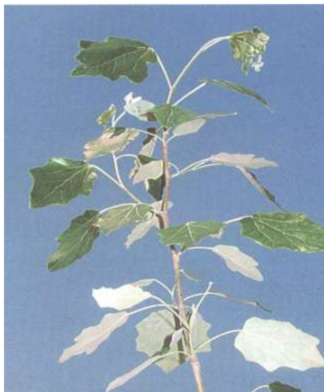
Рисунок 6 – Тополь белый, серебристый

Естественно произрастает на юге Западной Сибири, в Европе, Средней и Малой Азии, Монголии, Китае. В Западной Сибири встречается в поймах крупных рек (Обь, Иртыш, Тобол и др.). Растет одиночно и небольшими группами, реже входит в состав разреженных пойменных лесов. В горы поднимается до 1 150 м. Предпочитает средние по богатству и влажности почвы. Засухоустойчив. Светолюбив. Растет быстро. Долговечность 100–300 лет.