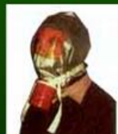
Самоспасатель промышленный фильтрующий