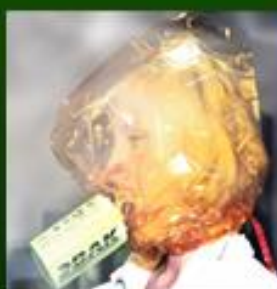
Защитный капюшон «ЗВСК»