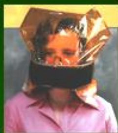
Защитный капюшон «Феникс»