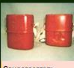
Самоспасатель фильтрующий шахтный