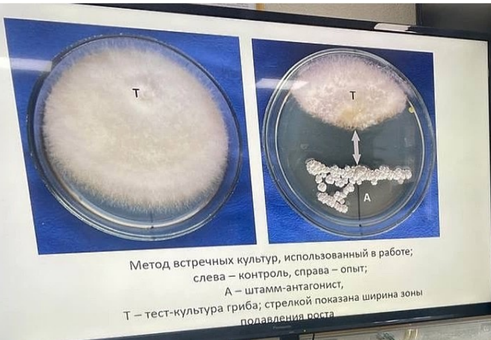
Метод встречных культур, использованный в работе; слева – контроль, справа – опыт; А – штамм-антагонист, Т – тест-культура гриба; стрелкой показана ширина зоны подавления роста