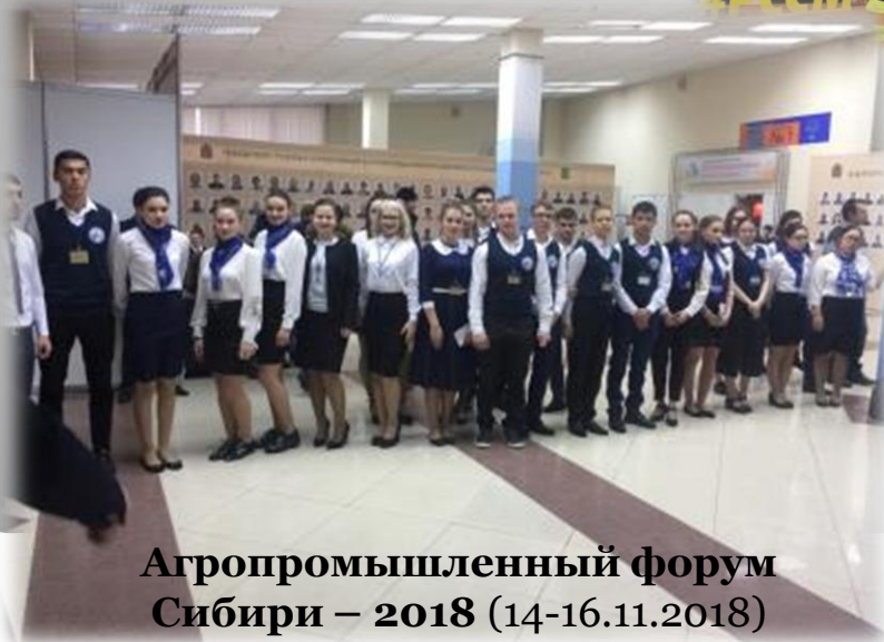
Агропромышленный форум Сибири – 2018 (14-16.11.2018)