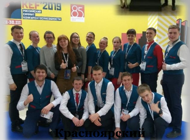
Красноярский Экономический форум – 2019 (28.03.19)