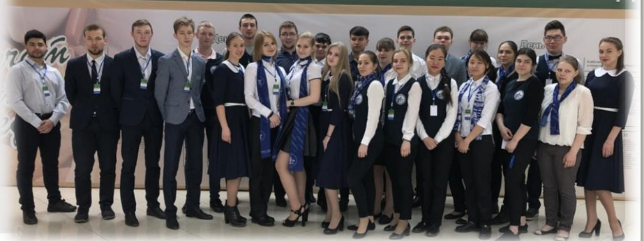
Международный форум пищевой индустрии (10-12.04.2019)