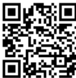
Рисунок 6 — Рекомендации по проведению кинопоказов в профилактике

Среди фильмов по тематике противодействия терроризму можно использовать следующие фильмы: «Беслан. Память» (Россия, 2014 г., возрастное ограничение: 12+), «Кавказский пленник» (Россия, 1996 г., возрастное ограничение: 18+), «Я не террорист» (Узбекистан, 2021 г., возрастное ограничение: 18+), «Отель Мумбаи: противостояние» (США, Австралия, 2018 г., возрастное ограничение: 18+) и т.д.