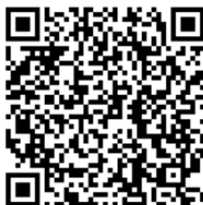
Рисунок 4 — Сценарий для проведения дебатов «Идеология радикализма»

Первая команда всегда будет представлять сторону радикальной идеологии. Задача команды студентов – найти контраргументы тех радикальных и спорных тезисов, которые будет озвучивать первая команда. Тем самым, участники будут вынуждены критически рассматривать постулаты радикальных идеологий, искать в них логические ошибки, несоответствия – самостоятельно приходиться к выводу о деструктивности любой радикальной идеологии (см. рисунок 4).