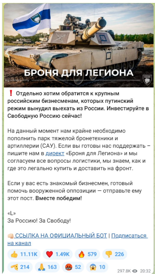
Рисунок 3 — Скриншот телеграм-канала легиона «Свобода России» с призывом к финансированию

Важно подчеркнуть, что помимо собственно пропаганды и распространения идеологии террористических организаций, а также вовлечения в деятельность террористических организаций существует еще одна угроза террористического характера — ложные сообщения о готовящемся террористическом акте. Только за 2021 год зафиксировано более 4,5 тысяч ложных сообщений о готовящихся терактах на объектах социальной инфраструктуры. Это может быть хулиганство, злой умысел, специфическое чувство юмора, желание проверить качество работы правоохранительных органов или антитеррористическую защищенность объекта и др. Во всех вышеперечисленных случаях за такой поступок придется нести уголовную ответственность. Ведь злоумышленник нарушает конструктивную деятельность общественных объектов, а правоохранителям приходится задействовать множество средств и сил, чтобы проверить объекты, которые якобы находятся под угрозой. За ложное сообщение о готовящемся теракте правонарушитель может быть наказан либо штрафами – от 200 тысяч рублей и до двух миллионов рублей, либо лишением свободы – от одного года до 10 лет. Ответственность за данный вид правонарушения наступает с 14 лет (статья 207 УК РФ «Заведомо ложное сообщение о акте терроризма»).