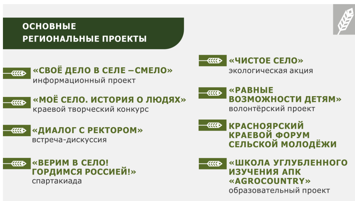
Рис.3. «Региональные проекты»

Сделать жизненный выбор, постоянно совершенствоваться, добивается поставленных целей, найти своё призвание и место в обществе быть довольным собой на этапе самореализации именно эти цели преследуют региональные проекты, реализуемые ФГБОУ ВО «Красноярский ГАУ» (Рис.3).