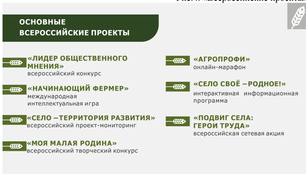
Рис.4. «Всероссийские проекты»

Как мы видим, проблема самореализации личности молодого человека сферах жизнедеятельности через интеграцию их в молодежные организации, объединения и инициативы позволяют избрать жизненную траекторию и реализовать себя.