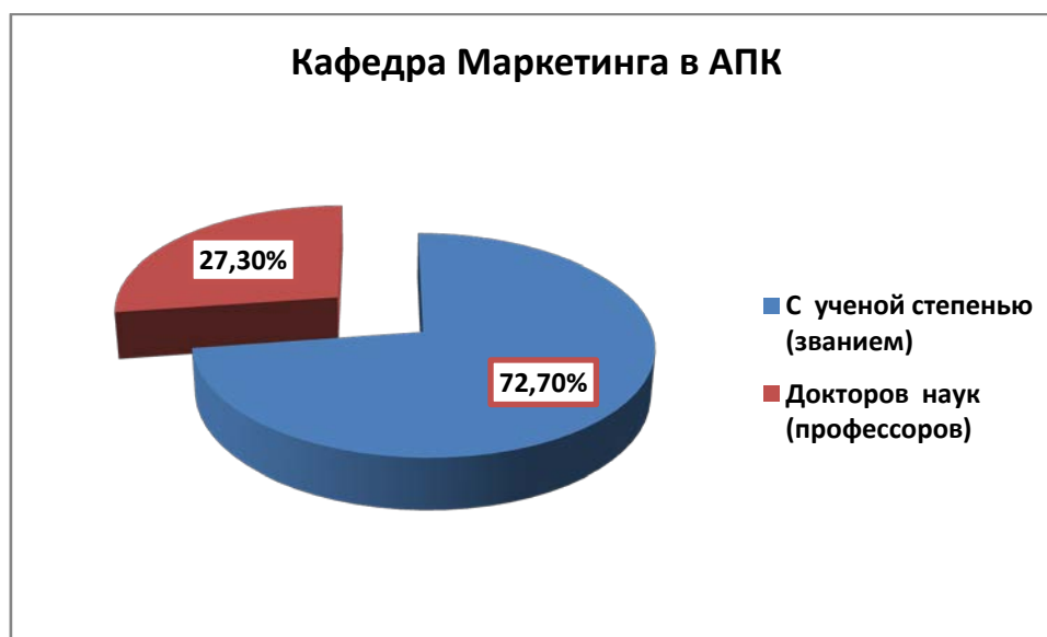
Рисунок 2 - Кадровый потенциал ППС, человек (% с ученой степенью к общему числу сотрудников)

Средний возраст ППС кафедры – 43 года. При этом количество штатных ППС с ученой степенью и/или званием в возрасте до 35 лет – 2 человека; количество штатных ППС с ученой степенью доктора наук и/или званием профессора в возрасте до 50 лет – 1 человек.