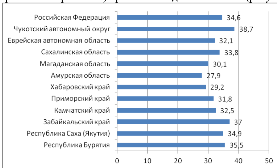
Рисунок 1 – Доля расходов домохозяйств на питание (на 01.01.2022 г.), % Источник: составлено по данным [6]

отображающих степень экономической доступности продовольствия для населения, является доля расходов в бюджетах домашних хозяйств на покупку продуктов питания. В мировой практике пороговое значение составляет 25% [5]. Если сложившийся уровень расходов на продовольствие выше порогового значения, это служит признаком бедности населения. В регионах ДФО (как и в большинстве российских регионов) проживает бедное население (рисунок 1).