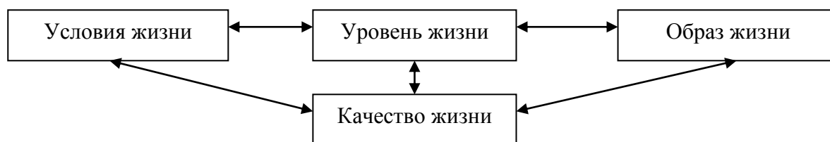
Рисунок 1 – Взаимосвязь категорий в исследовании жизнедеятельности населения

Но автор не раскрывает составляющие этих понятий и то, какими показателями можно измерить и оценить условия жизни, образ жизни и уровень жизни населения.