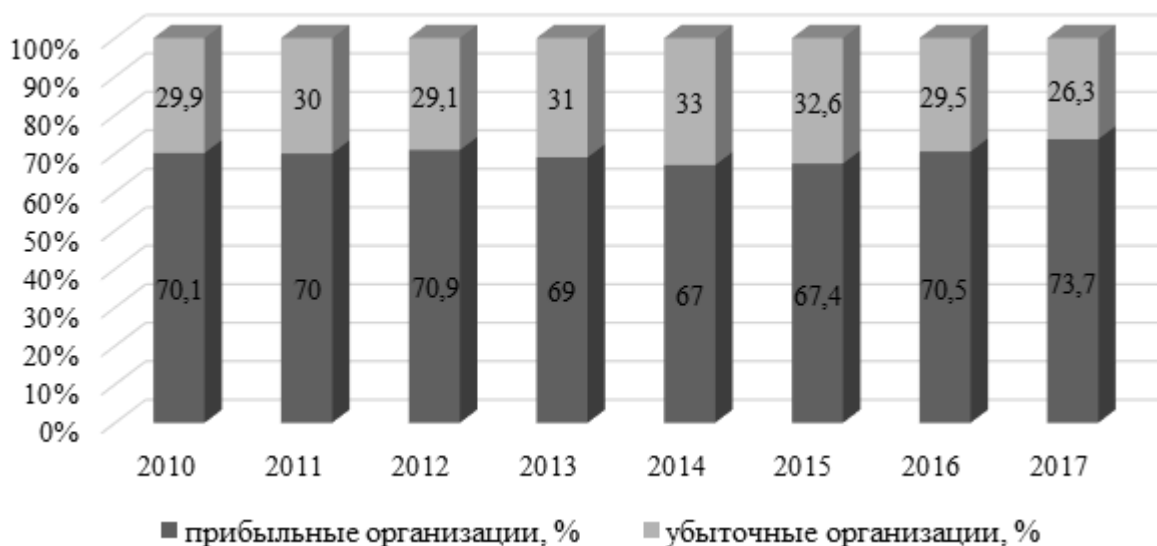
Рисунок 2 – Удельный вес российских предприятий по видам финансовых результатов, %

Эффективность деятельности организаций характеризуется показателями рентабельности, динамика которых представлена на рис.3.