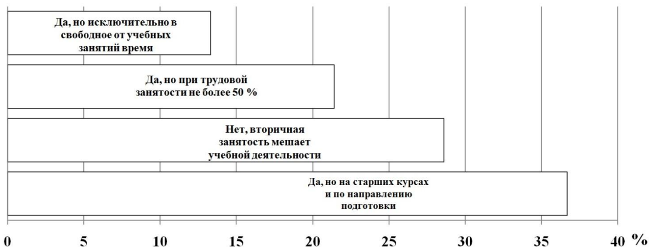
Рисунок 1 – Позиции студентов о возможности вторичной занятости в процессе обучения

Фактическое распределение студентов по наличию вторичной занятости показывает, что 35,7 % студентов трудоустроены и успешно совмещают работу с учебой (преимущественно в структурных подразделениях университета), а 64,3 % планируют трудоустроиться только после получения диплома о высшем образовании.