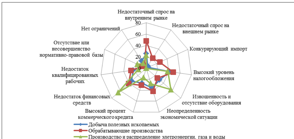
Рисунок 1 – Оценка основных факторов, ограничивающих рост производства, на предприятиях добывающих, обрабатывающих производств, производства и распределения электроэнергии, газа и воды в РФ на декабрь 2011г. в % от числа опрошенных [1]

По данным исследования международной компании Ernst & Young Global Limited [4] среди основных факторов, сдерживающих расширение деятельности в агропромышленном комплексе, респонденты в 2013г назвали - дефицит квалифицированной силы 61%, недостаток финансирования 56%, низкая маржинальность деятельности 50%, высокий уровень конкуренции 22%. Необходимо конечно, указать еще ряд специфичных факторов – отсутствие товаропроводящих каналов, необходимость создания площадок для переработки и/или хранения продукции, неблагоприятные климатические условия, низкий уровень социального обустройства, продолжающийся процесс дробления хозяйств и перехода на мелкотоварное производство.