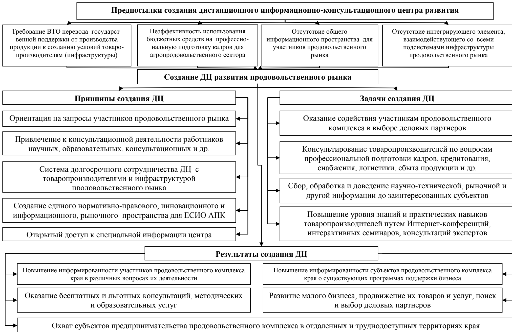
Рис. 1 Предпосылки, целевые ориентиры и задачи создания дистанционного центра развития продовольственного рынка