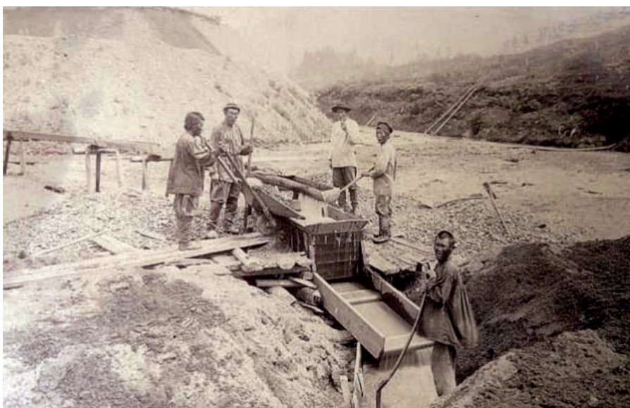
Рабочие на золотом прииске.

1879 год. «28 мая... русские около китайской границы ищут золото... сойоты чуть не убили искателя».