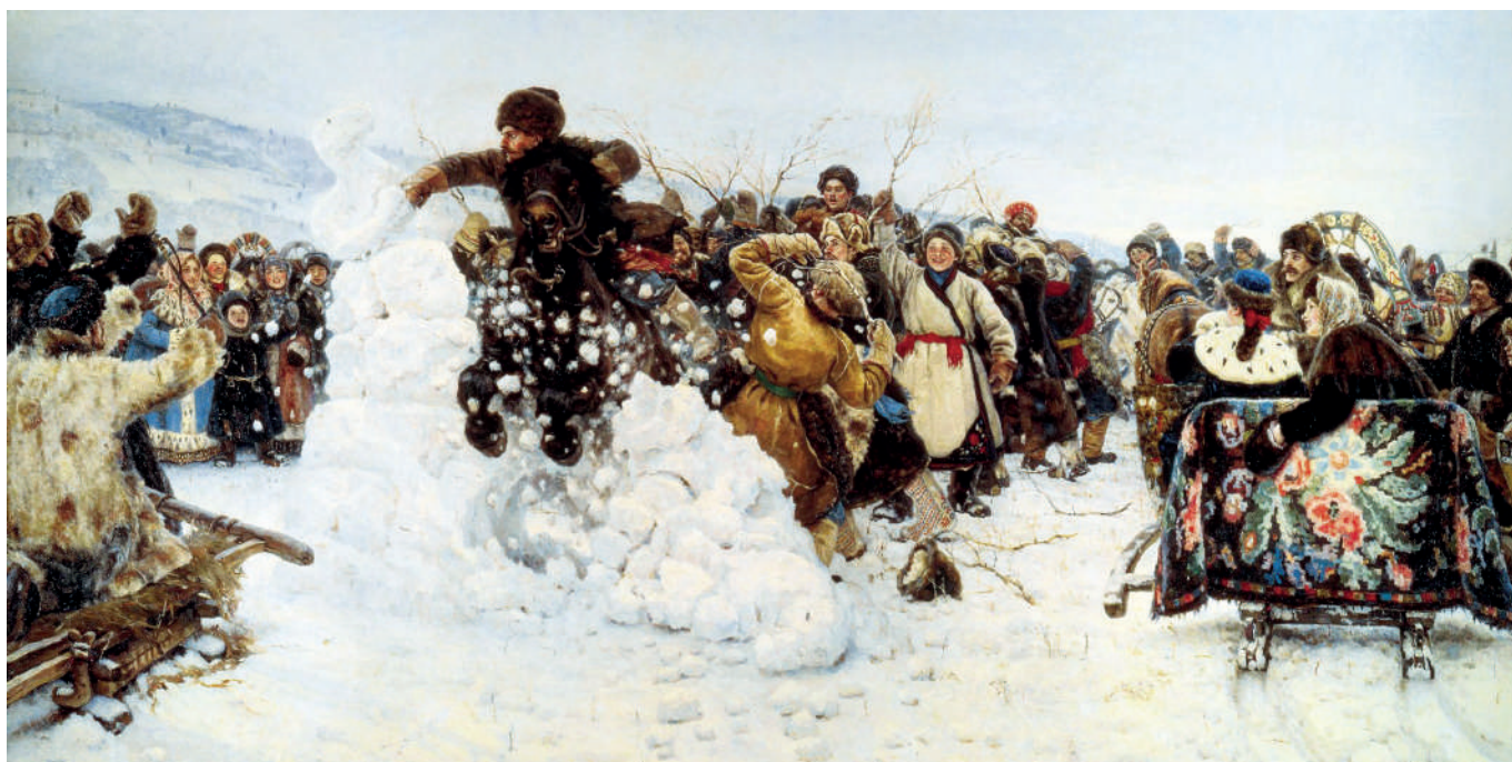
«Взятие снежного городка», В. И. Суриков