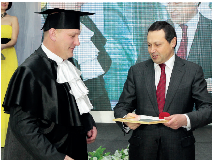
Награждение премией Главы города Красноярска

Затем почти десять лет он работал доцентом кафедры безопасно-