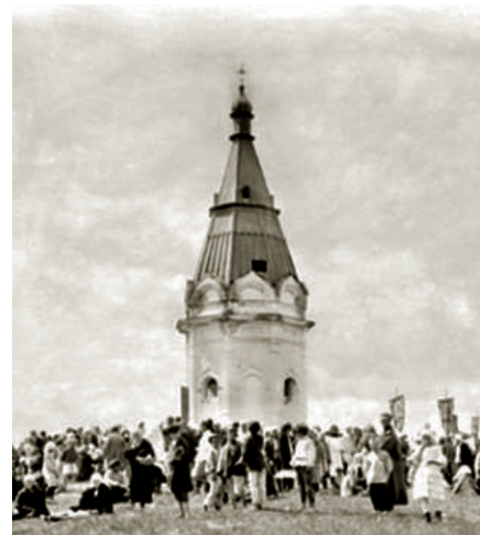
Часовня Святой Великомученицы Параскевы Пятницы. 29 мая 1912 г.

Второй документ от «марта 31 дня 1806 года» был направлен «Антонию Архиепископу Тобольскому и Сибирскому» от имени «Томской губернии Красноярского Городского главы Новикова». Называлось – «Прошение». Сообщалось, что «...учинено постановление о намерении по общему желанию к возобновлению древнего, Благочестивого обыкновения за рекою Качею на месте достойном