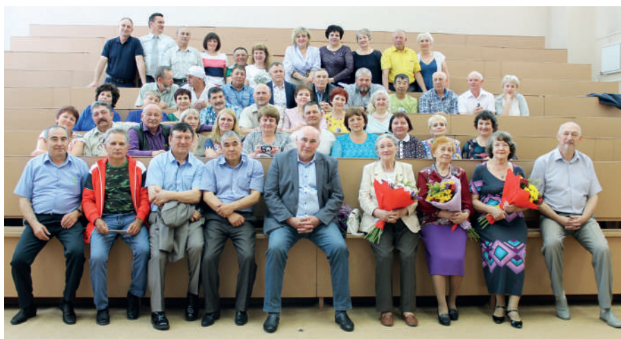
Встреча с сокурсниками-агрономами спустя 35 лет, ИАЭТ, 2018 г.

В период вегетации проводили мониторинг питания овощных культур. Урожай собирали вручную, отбирали почвенные и растительные