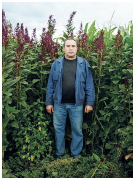
Демонстрация высоты насаждений с амарантом, учхоз, 2019 г.

– Родился и вырос в селе Арбат в Армении. После окончания школы в 1978 году прилетел в Красноярск. Поступил на один из четырёх факультетов Красноярского сельскохозяйственного ин-