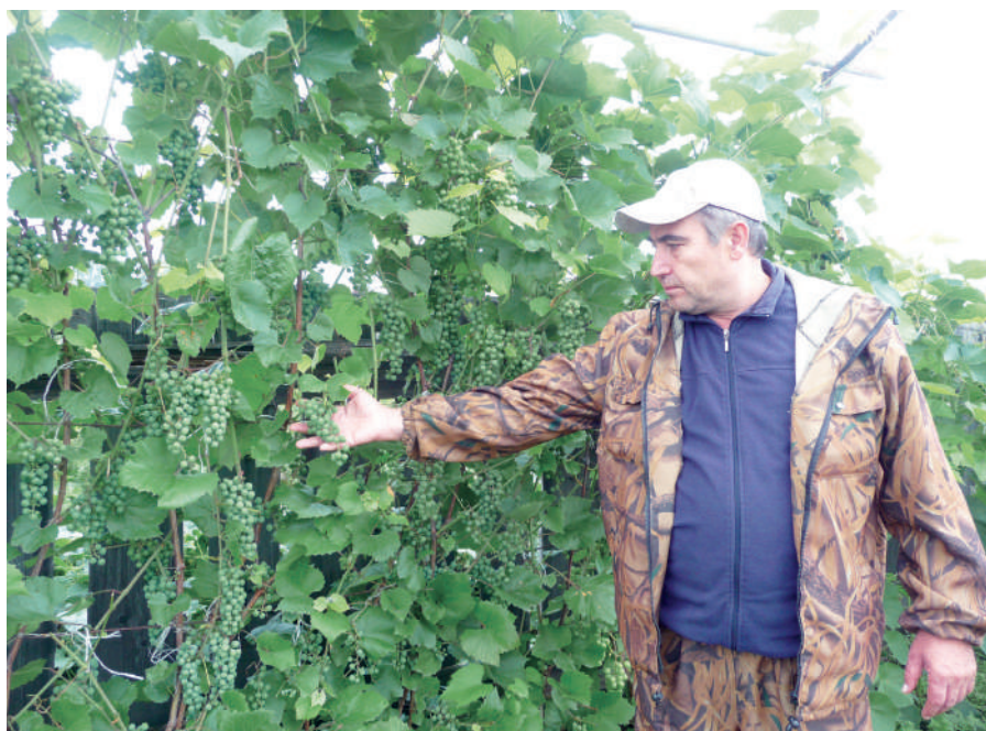
Кусты винограда в Ермаковском районе, 2019 г.