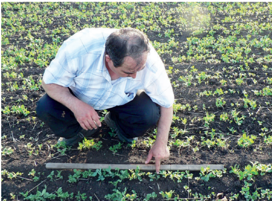
Биометрия всходов кормовых культур, 2018 г.

образцы, анализировали их минеральный состав. Проверяли продукцию на показатели нитратов, витаминов, сахаров и сухих веществ. Самостоятельно выполняли биохимические и химические анализы образцов.