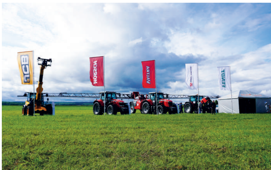
Площадка «АгроЦентрЗахарово» на форуме «День поля»