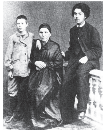
Суриков с братом и матерью

Если обойти кругом тот дом, стоящий ныне по адресу улица Ленина, 87, то увидим, что он расширился. И с середины XIX века в нём уже располагалось Красноярское уездное училище. Об этом мы можем узнать из архивного документа от 1 мая 1851 года за № 140: «Апреля дня... с избранным от