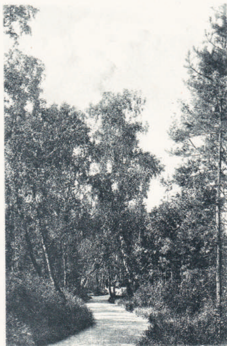
12 Городской сад — боковая аллея Le jardin de ville — l'allée latérale

Начинается «Алфавит» с перечисления площадей. Их пять. В городе тогда уже был «Публичный сад» (ныне Центральный парк). Далее перечислены продольные улицы. Главная – Воскресенская – ныне проспект Мира. Были и другие улицы, но они шли от Енисея к реке Кача. Их было 16. Первая – Блицинская (Каратанова). Третья – Дубенская – теперь улица Парижской Коммуны. Восьмая – Степановская – в честь первого енисейского губернатора А. Степанова. Были «в слободе за Качей 1) Береговая, 2) Средняя и «Несколько безымянных переулков. Итого: 27 улиц» (ГААК, ф. 224, оп. 1, д. 8.).